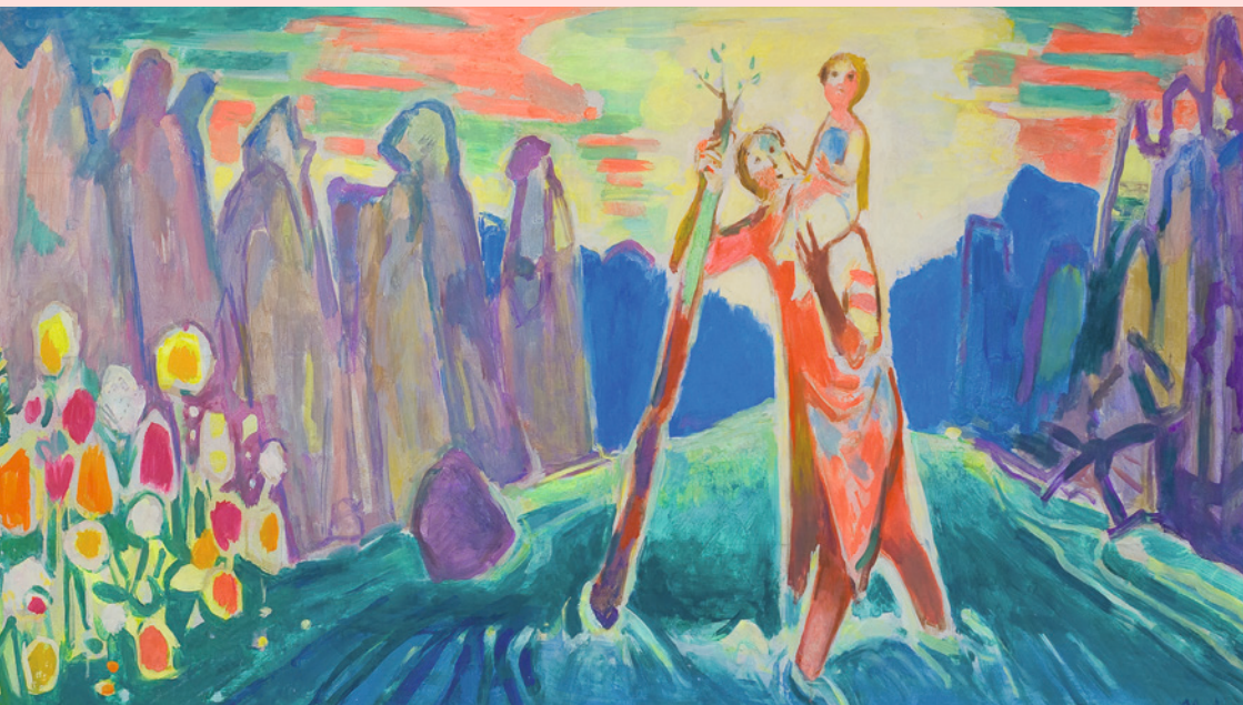
„Christophorus“ von Carl Clobes, 1993, im Foyer unseres Kindergartens